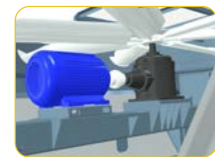
i Transmisión con caja reductora (opcional)