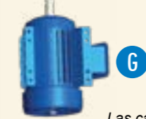
Las cantidades pueden variar en función del modelo del equipo.